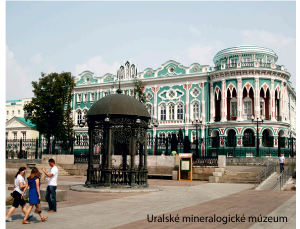
Uralské mineralogické múzeum