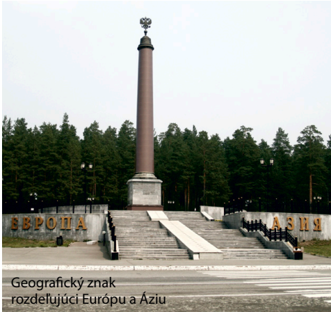
Geografický znak rozdeľujúci Európu a Áziu