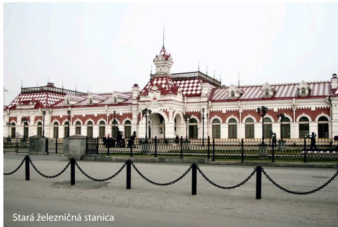
Stará železničná stanica

Posedeli sme si, trochu sa porozprávali a pozreli sme si doterajšie fotky. Večerná toaleta prebehla vo veľmi útulnom, ale aj čistom a udržiavanom prostredí, na ktoré sme si počas cestovania zvykli, keďže to bolo jediné miesto, kde sme sa mohli, počas nášho cestovania vlakom, umývať. Nepočítam prestávky v mestách, v ktorých sme strávili viac ako jeden deň. Tam sme mali ubytovanie a sprchu bez toho, aby sa s nami všetko triaslo. Večer sme si ľahli každý do svojho peliešku a zaspávali ako keď matka uspáva dieťa v kočíku, do toho monotónne „tt tt“ a ani nevieme, ako rýchlo sme zaspali. Napriek tomu, že sa mi vo vlaku spalo dobre, ráno som vstával skoro. Ranostaji majú vo vlaku výhodu toho, že pokiaľ väčšina osadenstva spí, tak toaleta je voľná a ranná hygiena sa vykonáva v pokoji. Holenie je náročnejšie pokiaľ sa holíte žiletkou, nakoľko sa vlak neustále trasie. Zvykol som si na to, ale elektrický holiaci strojček by bol veľkou výhodou. Na chodbe každého kupé sa hneď vedľa sprievodcu nachádza samovar, v ktorom je k dispozícii stále horúca voda na zaliatie čaju, kávy, instantných jedál. U sprievodcu je možné si kúpiť drobnosti na jedenie a pitie, ale aj drobné suveníry, väčšinou s motívom ruských železných dráh. Ak nemáte pohár na čaj, nie je problém si ho u sprievodcu kúpiť, ale veľmi ochotne ho aj požičia bez akejkoľvek zálohy. Po zobudení aj posledného účastníka zájazdu, nastal čas na raňajky pozostávajúce z rybacích konzerv