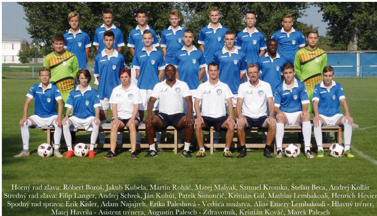
FK Slovan Most pri Bratislave U19, 2016/2017