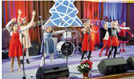
Školský rok v ZŠ a MŠ