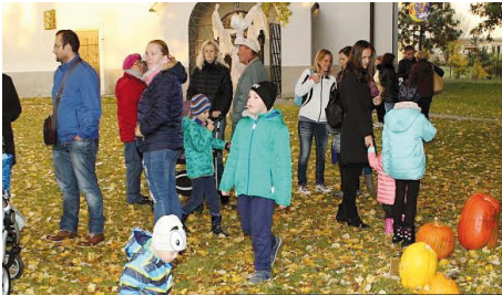
Aktivity v našej obci