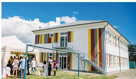
Otvorenie novej budovy ZŠ