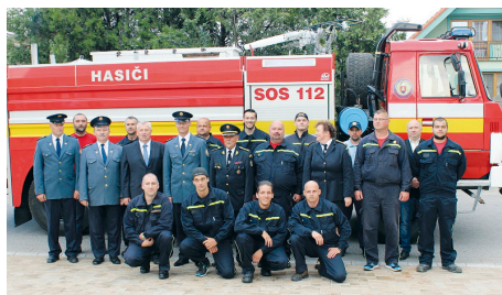
Hasičské auto už aj v Moste