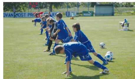
Rozpis futbalových zápasov 2016/2017