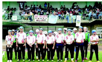
Úspech našich hasičov