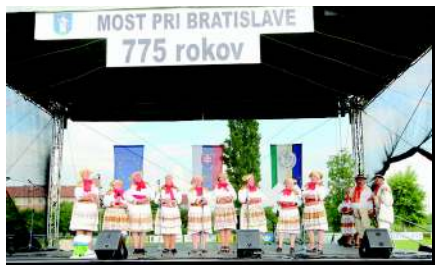
DEŇ OBCE - 775. výročie